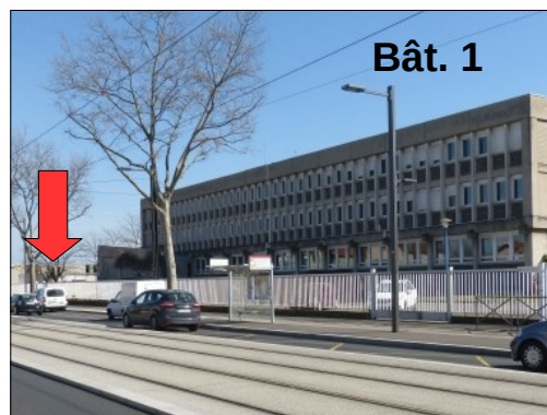
Entrée piétons de la cité des Mobilités

Sonner à l'interphone du site pour pouvoir entrer