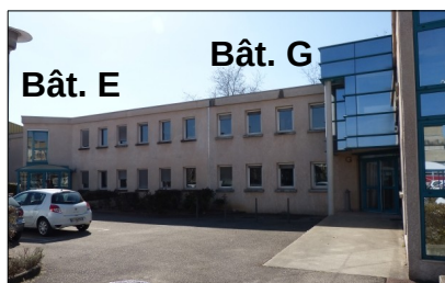
Entrée des bâtiments E et G