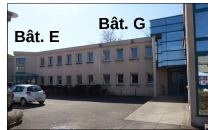
Entrée des bâtiments E et G