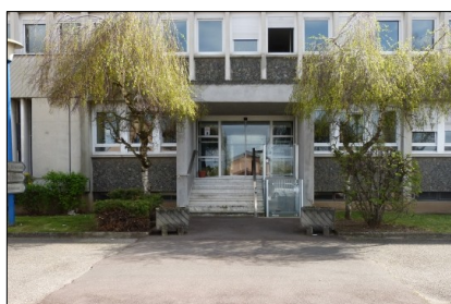
Entrée du bâtiment 1