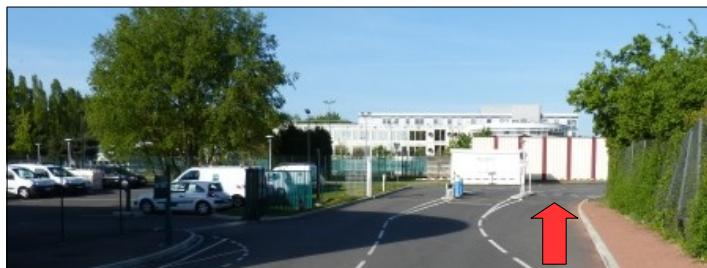
Entrée véhicules de la cité des Mobilités